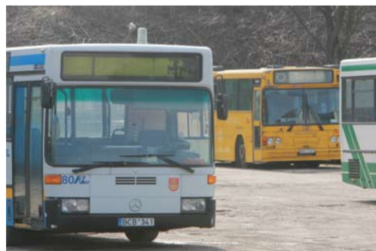
Dalyje Lietuvos savivaldybių keleiviai vietiniais autobusais gali važiuoti nemokamai po visą rajoną.

Robertas ALEKSIEJŪNAS robertas.a@anyksta.lt