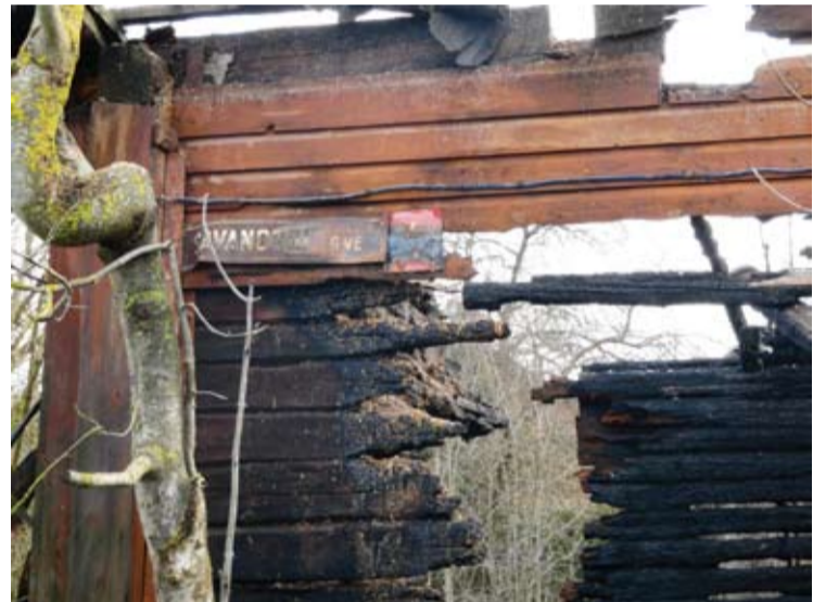
Naktį iš šeštadienio į sekmadienį sudegė Kavarske, Savanorių gatvėje, esantis negyvenamas namas.