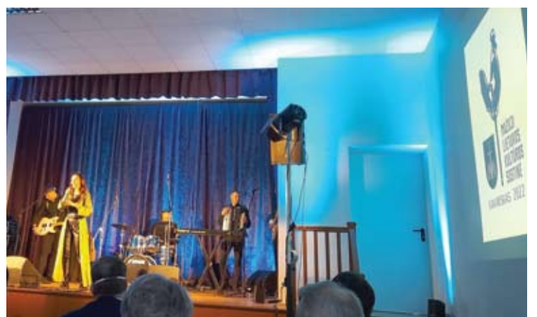
Kavarske pirmąjį koncertą 2022 metais surengė postmoderniojo folkloro grupė „Kitava“ iš Šiaulių.

Lietuvos mažosios kultūros sostinės simbolinė vėliava visus metus puoš Kavarsko miesto centrą.