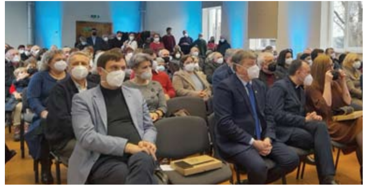
AKC Kavarsko skyriaus salėje buvo daug žmonių.