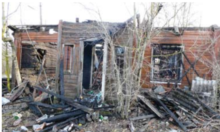
Per dvi dienas Kavarske kilo trys gaisrai.